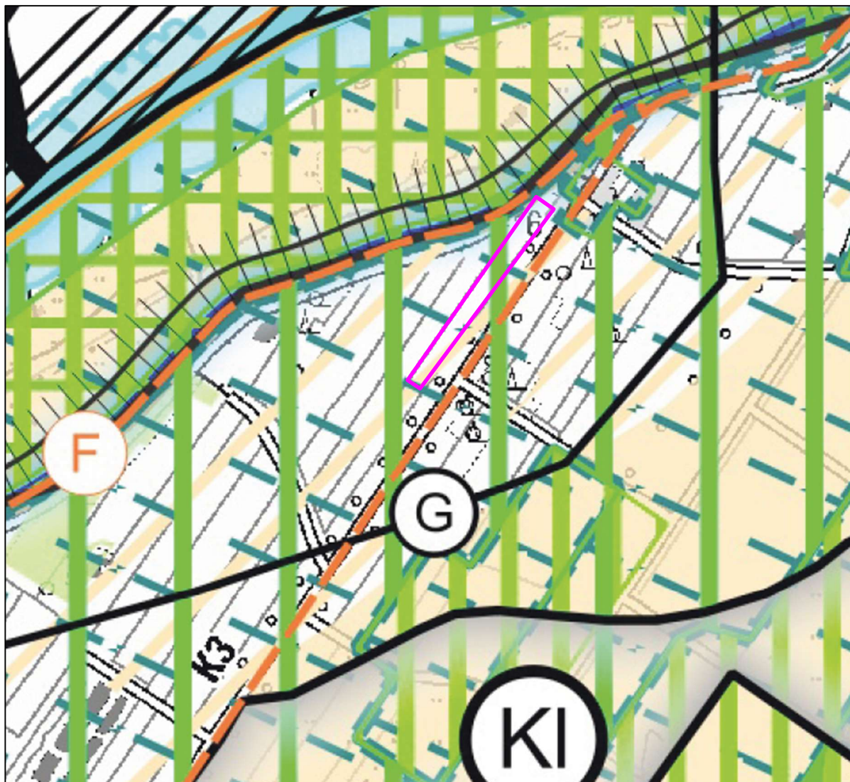
Abbildung 3: Auszug aus dem 1. Entwurf zur Neuaufstellung des RROP 2025, Beschlussfassung 19.03.2026 mit Kennzeichnung der Lage des Plangebietes (magentafarbene Linie) (ohne Maßstab).