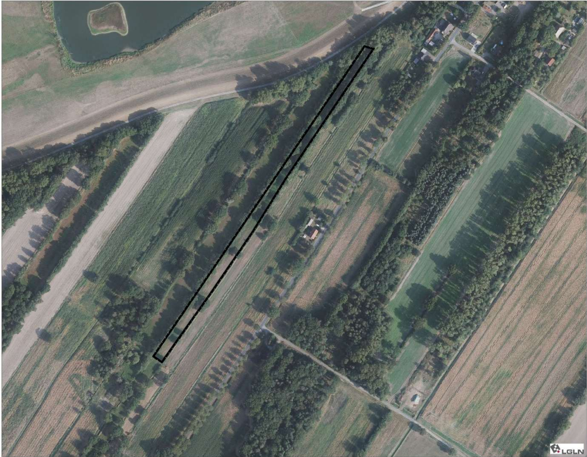
Abbildung 1: Luftbild mit Kennzeichnung des Plangebietes (schwarze Linie), Quelle: Digitale Orthophotos, Stand 2024 Auszug aus den Geodaten des Landesamtes für Geoinformation und Landesvermessung Niedersachsen ©2025 LGLN